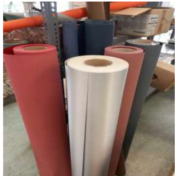
Mondiál könyvkötő vásznak