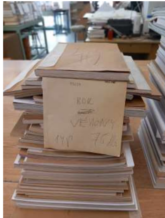
Vékony könyvtáblába való bekötésre váró könyvek