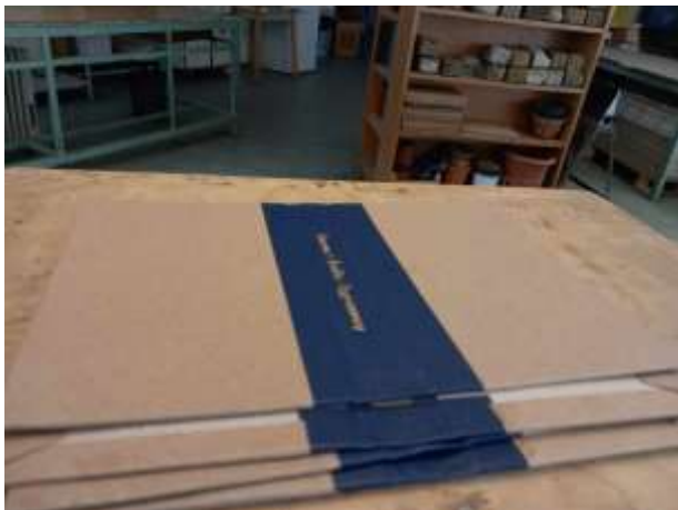
Aranyozott vékony könyvtábla