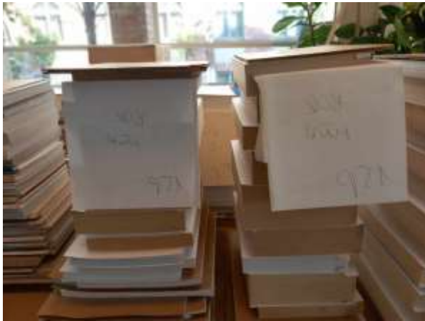
Könyvgerinc kenésre előkészített könyvek