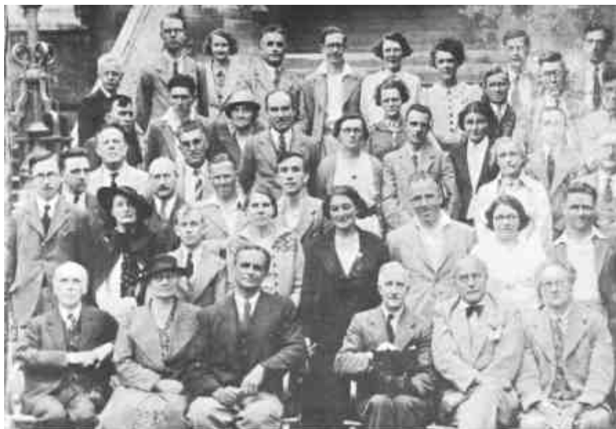
Polányi Károly mint a Workers' Educational Association tanára tanítványai körében (alsó sorban jobbról a második)