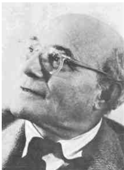
Arképe az ötvenes évek végén