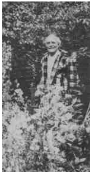
Pickeringi házának kertjében a 60-as években