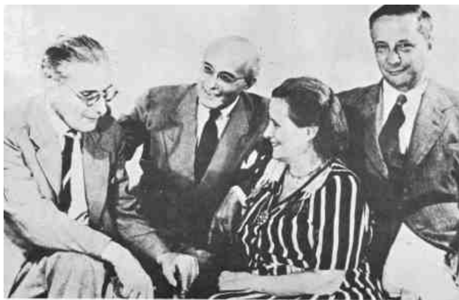
A Polányi testvérek (jobbról balra: Mihály, Laura, Károly, Adolf)