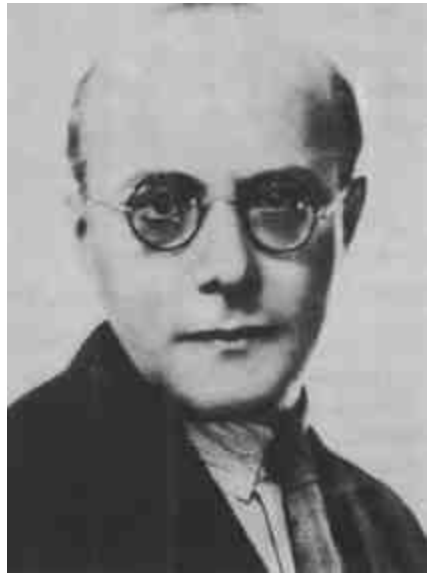
Portré a 30-as évekből