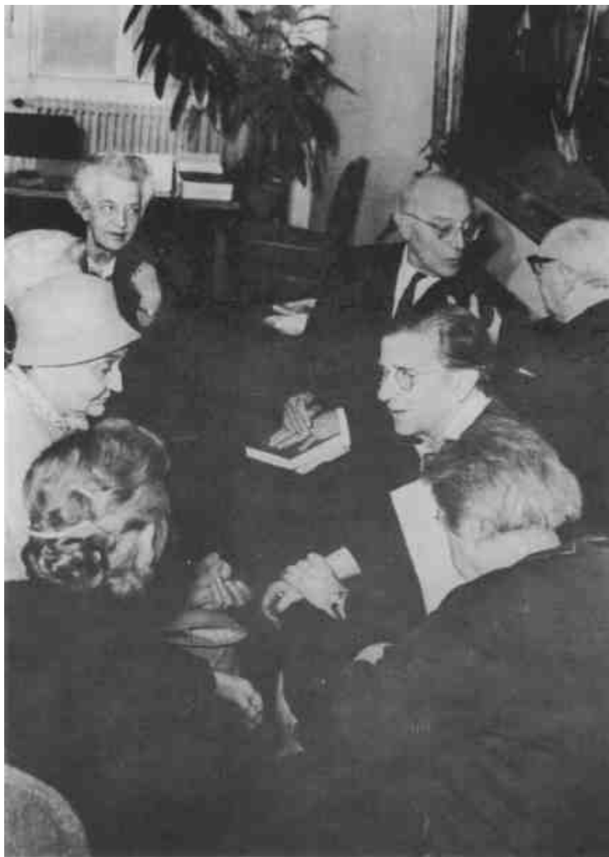
Volt Galileisták között 1963-ban