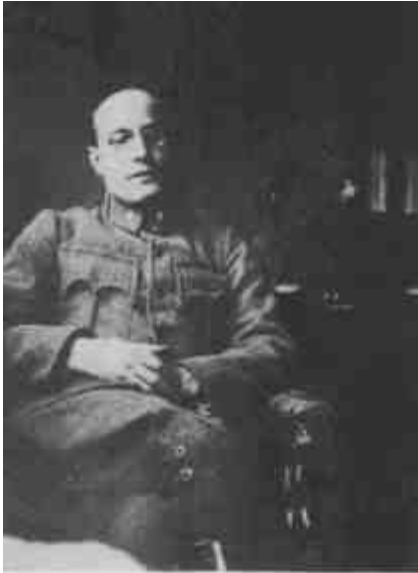
Polányi Károly 1917 körül