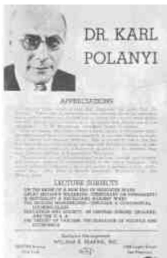
New York-i előadásorozó - tának hirdetése