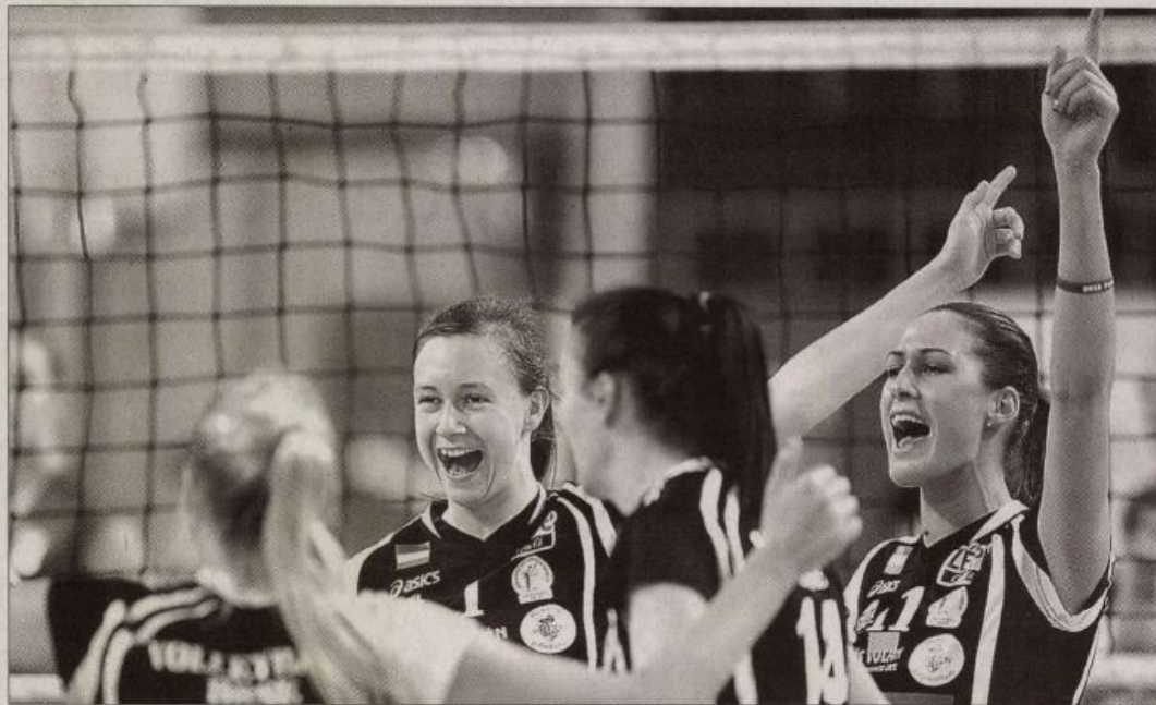
A bajnoki döntőben a Békéscsaba nem hibázott, 3-0-s összesítéssel kerekedett a címvédő Vasas fölé